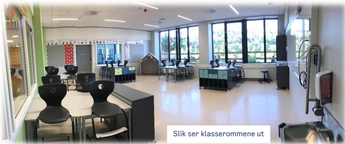
Slik ser klasserommene ut

På Brynseng er vi opptatt av miljøet og jobber for å bruke minst mulig ark. Når du begynner på AKS, får du en tegnebok med navnet ditt på. I den kan du tegne, male og lime så mye du vil. Boka skal alltid være på AKS.