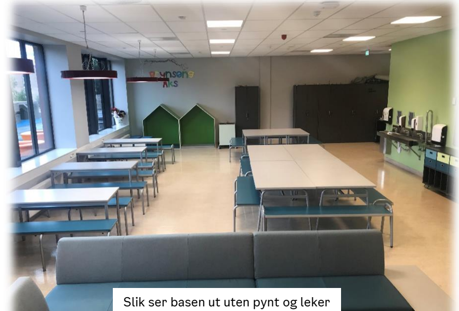
Slik ser basen ut uten pynt og leker

Aktivitetsskolen er en litt annerledes plass å leke i enn barnehagen. Vi har noe vi kaller for basen og det er et stort rom med leker, tegnesaker og lesehus. Resten av rommene i gangen er klasserom. De låner vi noen ganger til aktivitet og spising.